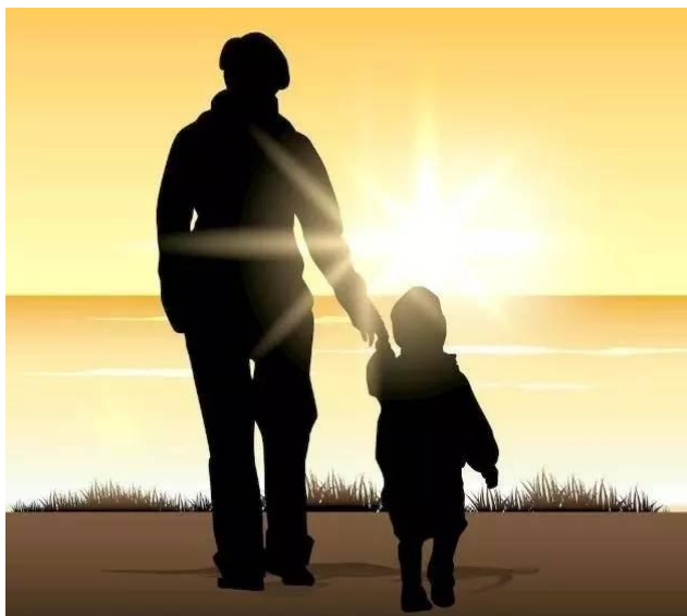
圖：媽媽總希望孩子能健康平安、開心地長大。

或因清寒家庭的雙親工作不穩定，原先家庭經濟狀況就為低收入戶，又於目前台灣經濟蕭條下，經濟更是難翻身，造成孩子需跟著大人受苦、家中無法提供良好的生活環境、教育學習環境、甚至衣物可能撿拾舊衣回收箱裡的、或募集鄰居親友整理好的二手衣物以供保暖之需，但天下父母心，心中總是期盼孩子能過得比自己好。