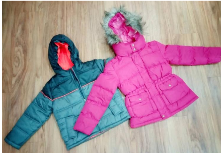
圖: 贈予弱勢孩童的全新鋪棉外套。